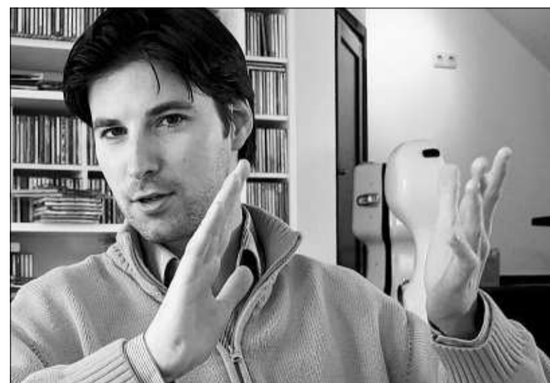
Daniel Müller-Schott: „Zu meinem Cello habe ich ein sehr persönliches, ja geradezu inniges Verhältnis.“

MÜLLER-SCHOTT: Beides halte ich für sehr wichtig. Die Weiterbildung für alle jungen Musiker muss vielschichtig und kontrastreich sein. Ich war seinerzeit dankbar für die Möglichkeit, während meiner Ausbildung die unterschiedlichsten Schulen und Richtungen kennenzulernen. Diese Erfahrungen will ich jetzt weitergeben.